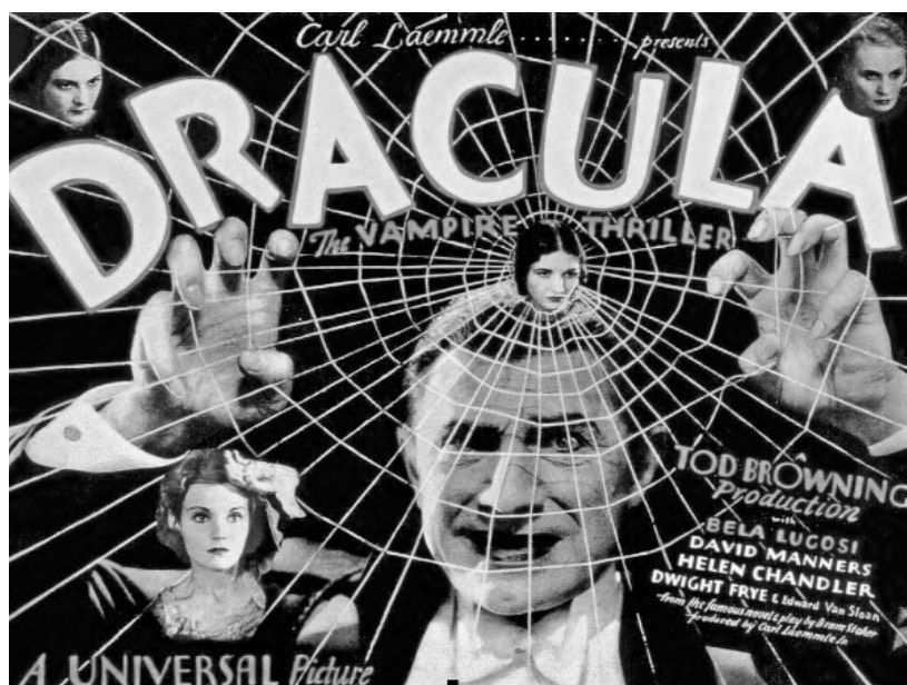
Drácula (Tod Browning, 1931).

Por otra parte, el silencio que encontramos en ciertos filmes de principios del sonoro es un silencio semánticamente vacío . Es un espacio blanco que ni ha sido rellenado con música y diálogo ni se aprovecha para jugar con las posibilidades tímbricas y dramáticas de los ruidos diégéticos y los efectos sonoros. Y tampoco es un silencio «puro»: está presente un constante soplido —producto de un momento en el que aún no se aplicaban técnicas de grabación con reducción de ruido—, un sonido que no pertenece a la diégesis, pero que tampoco aporta información alguna ni permite el embellecimiento que proporcionaría la música. Paradójicamente, el cine nunca estuvo en toda su historia tan cercado y amenazado por el silencio como cuando descubrió el sonoro. El antiguo miedo al ruido del proyector se hacía realidad de nuevo: si bien la banda óptica no registraba el sonido de la cámara (que se arropaba con blindajes) y las cabinas de proyección estaban insonorizadas, el soplido de la grabación delataba la naturaleza mecánica del artefacto cinematográfico y desbarataba la ilusión de la representación.