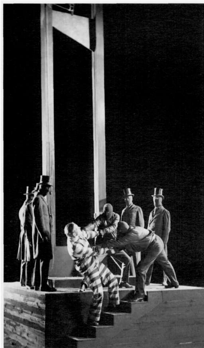
Die Liebe der Jeanne Ney (G. W. Pabst, 1927)