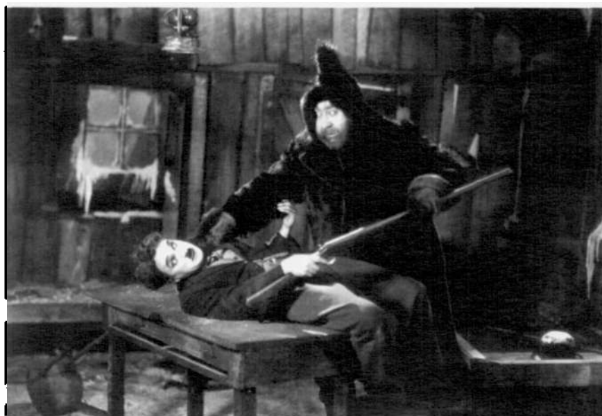
The Gold Rush (La quimera del oro. C. Chaplin, 1925)