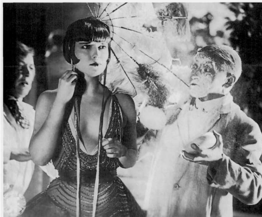
Die Büchse der Pandora ( La caja de Pandora , G. W. Pabst, 1929)