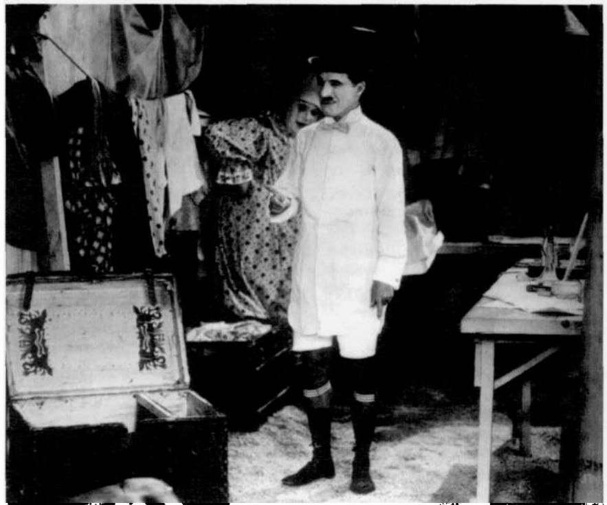
The Circus (El Circo, Charles Chaplin, 1928)

El modo en el que el crítico se desembaraza del problema de las diferentes bases técnicas del cine y de la pintura constituye una clara referencia a los principios de la estética de Croce. Ragghianti se basa en la distinción entre arte y técnica y sostiene que cuando la forma artística se ha perfeccionado, esto es, cuando se ha convertido en expresión, exige ser analizada como tal. Es verdad que uno siempre puede ocuparse de niveles que subyacen a la expresión, como, por ejemplo, la téc-