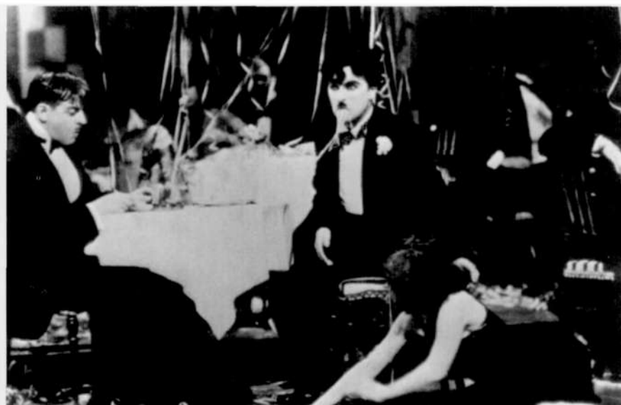
City lights (Luces de la ciudad, Charles Chaplin, 1930)

11. GIAN PIERO BRUNETTA: Storia del cinema italiano , vol. II, Roma, Editori Riuniti, 1993, págs. 207-208.