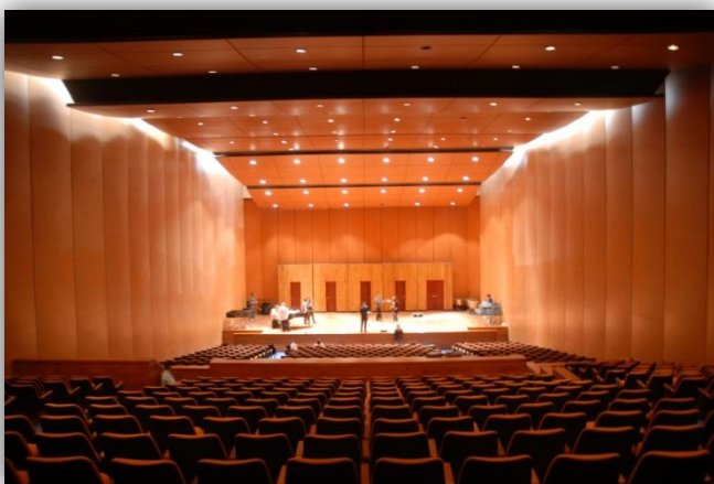
Teatro de Bogotá

Este gran evento, que busca fortalecer y fomentar la participación activa de todos los que algún día pasaron por las aulas de nuestra alma máter, se llevará a cabo el próximo 12 de agosto en el Teatro de Bogotá, ubicado en la calle 22 # 5-66, a partir de las seis de la tarde.