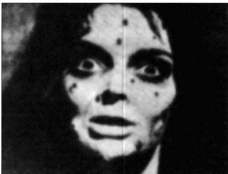
Ilustración 4 y 5. Fotograma de la película «Interview with the Vampire» de Neil Jordan (1994). La «vampirización» mantiene hermoso al vampiro, en contraposición a la vampiro Asa (Barbara Steele), protagonista del film de Mario Bava «La Maschera del Demonio») (1960).