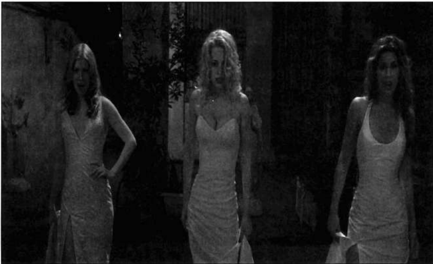
Ilustración 7. Fotograma del film de Patrick Lussier «Drácula 2000» (2001), que en España se estreno bajo el título de «Drácula 2001». La figura de la mujer vampiro ha sido tratada por el género como sumisa a su creador y dominante con sus víctimas.