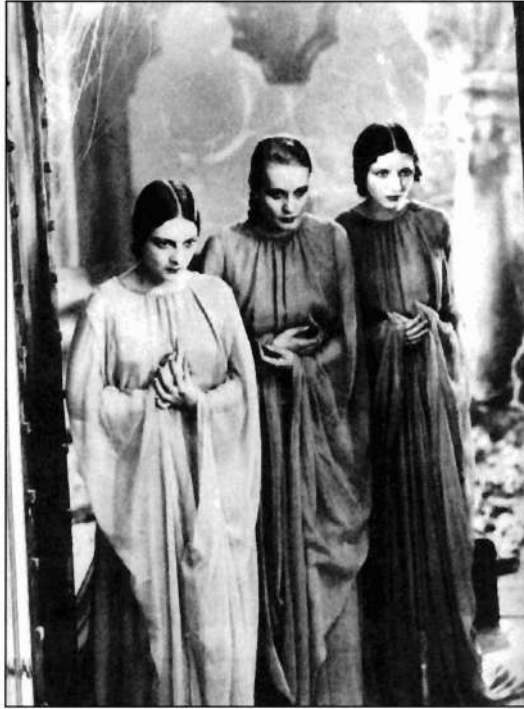
Ilustración 6. Fotograma de la película «Drácula» de Tod Browning (1931).