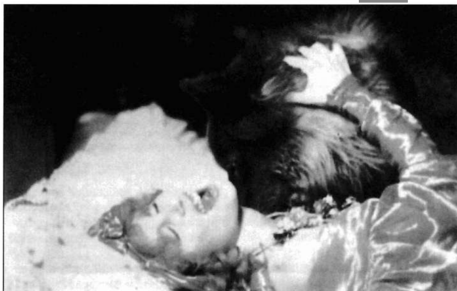
Ilustración 2 y 3. Francis Ford Coppola nos dio una imagen directa de la relación del vampiro con la zoofilia. Algunos de estos fotogramas del film «Drácula de Bram Stoker» (1993), fueron eliminados por la censura estadounidense.