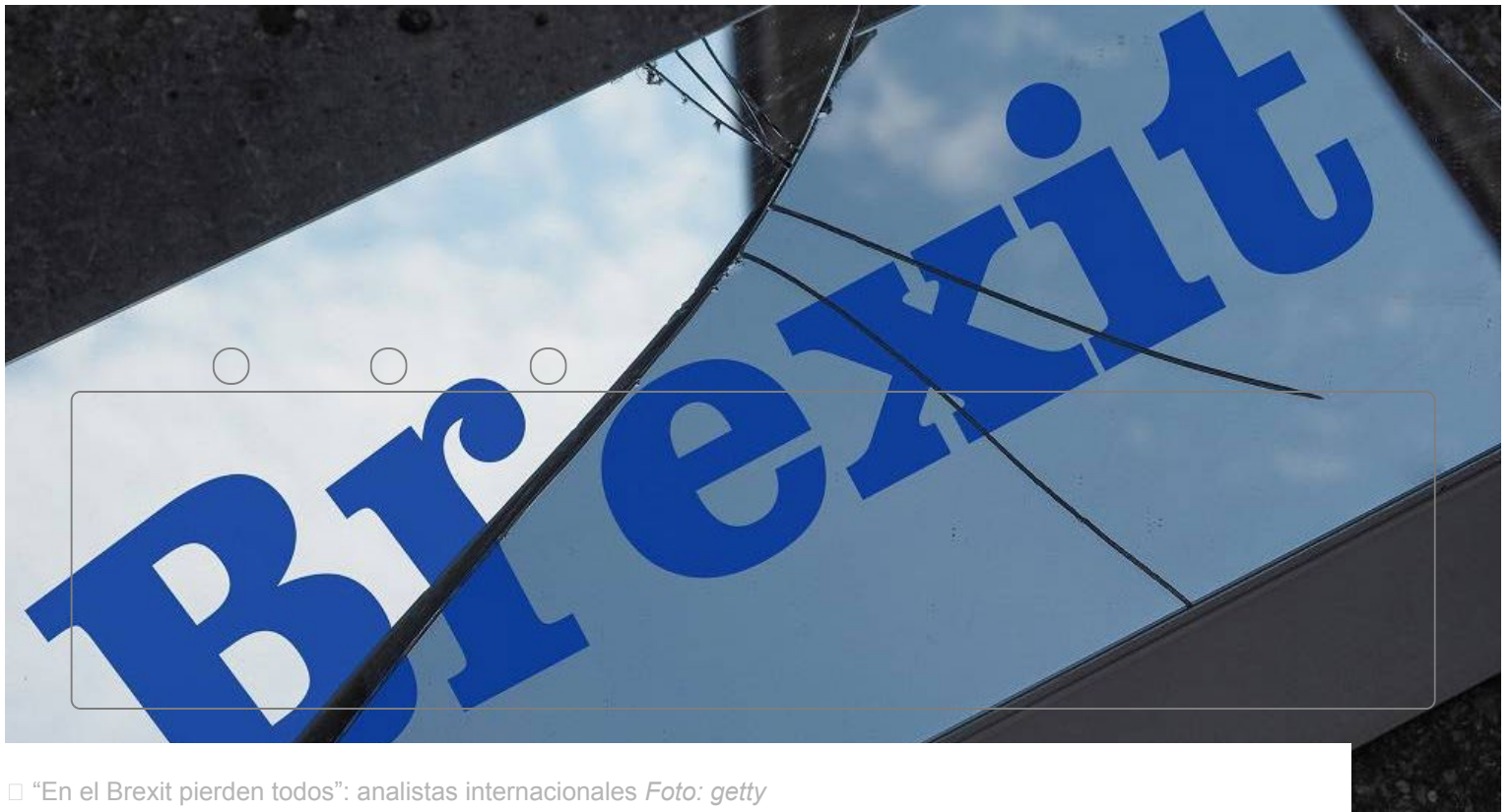
□ “En el Brexit pierden todos”: analistas internacionales