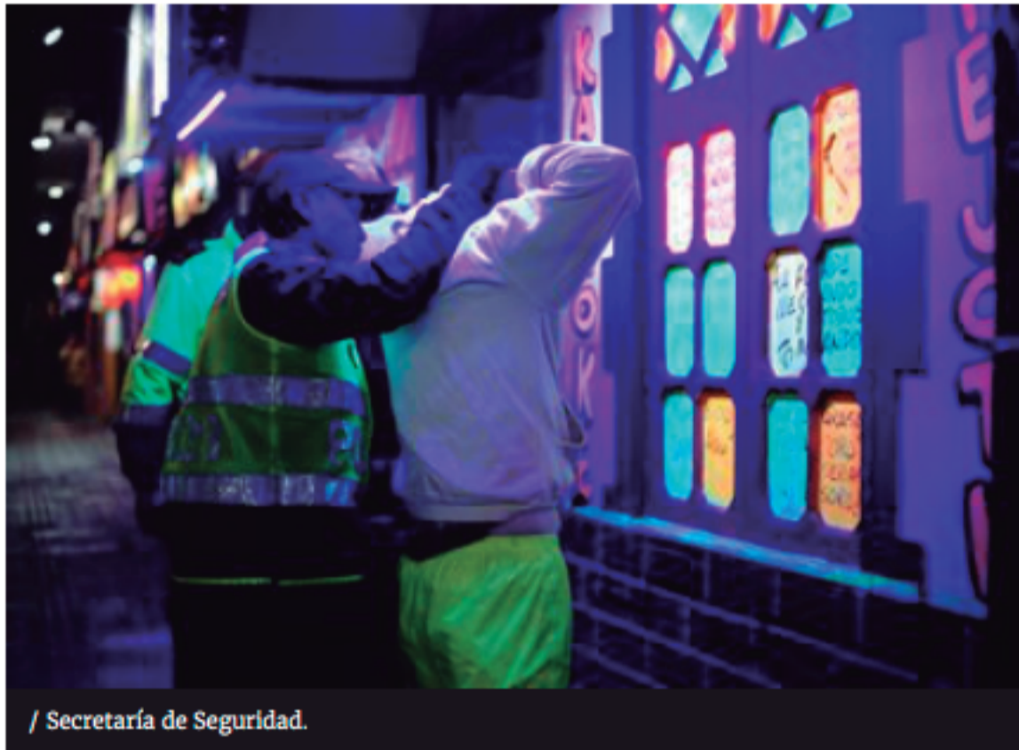
/ Secretaría de Seguridad.

La Policía y la Secretaría de Seguridad llevaron a cabo un operativo en el que fue necesario el cierre de unas 12 cuadras para registrar discotecas, moteles, cigarrerías del barrio Restrepo. Tras los operativos, siete menores de edad fueron conducidas a centros de protección y ocho discotecas fueron selladas por venta de licor adulterado.