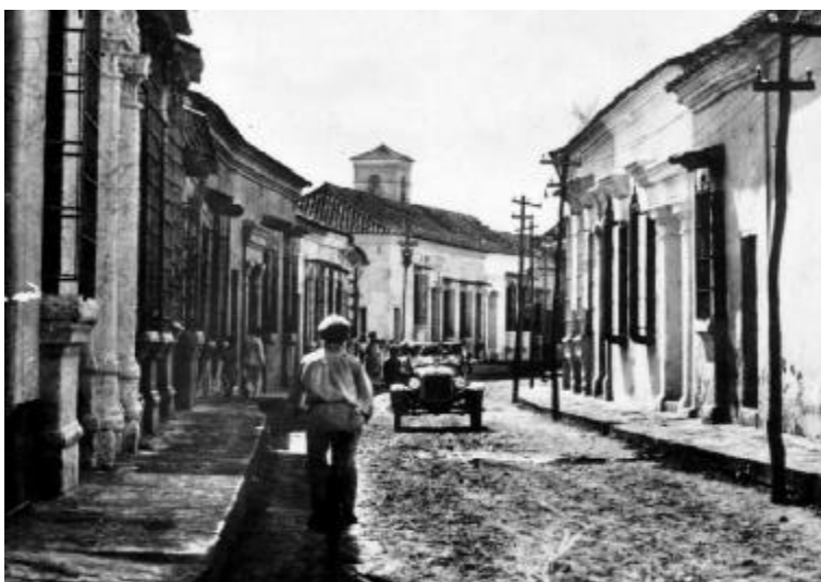
Mompox (detalle), Juan Trucco, 1920. BPPM.

Las preguntas para los nuevos historiadores del trabajo se convierten en ¿cómo, bajo condiciones de cambio económico rápido, inducido por los extranjeros, y el influjo masivo de población, se construyen la raza, la etnicidad, el género y la clase? ¿Cómo se construyen socialmente y por qué, y qué tipos de tensiones emergen? ¿Cómo recurren las