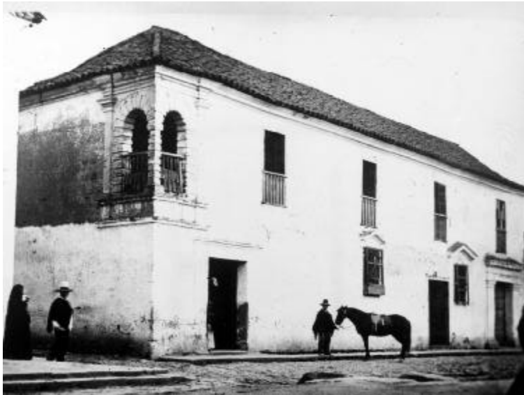
Antiguo Palacio de los virreyes (demolido), construido en 1787 por Domingo Esquiaqui, Bogotá, Julio Racines, 1884. BPPM.

a ser visto como un proceso sin rostro que se desarrolló con inconsútil inevitabilidad, penetró en nuevas áreas y las convirtió para sus propósitos. Se pensaba que las transformaciones en la organización del capital y del comportamiento empresarial respondían a cambios de estructuras y fuerzas económicas abstractas.