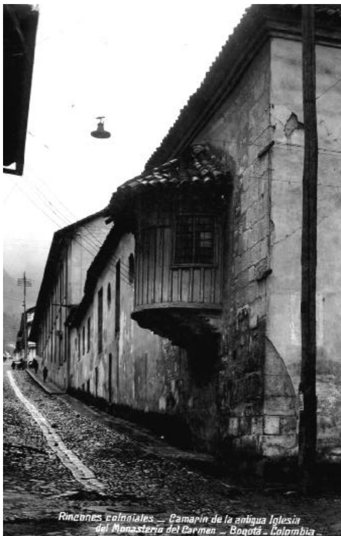
Rincones coloniales — Camarín de la antigua Iglesia del Monasterio del Carmen — Bogotá — Colombia

Mientras que las interpretaciones de la modernización, por un lado, y del imperialismo o la dependencia, por el otro, estaban en disputa, ambas presentaron los enclaves bajo el poder de compañías extranjeras y las sociedades de los enclaves como el resultado de la confrontación entre jefes foráneos y una masa obrera masculina proletarizada, que tomó significado nacional con el nacimiento de los movimientos obreros radicales. El capitalismo tendió