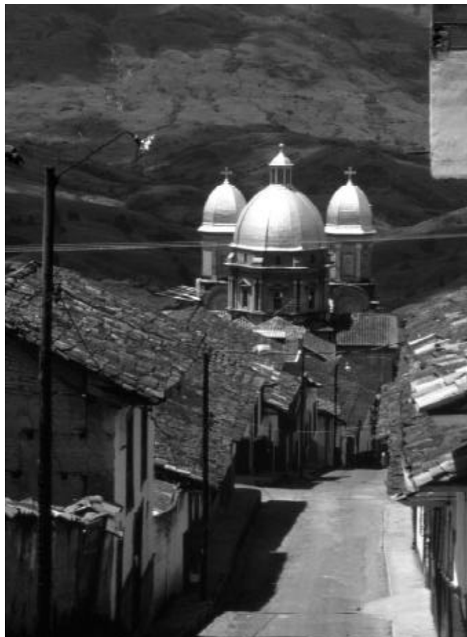
Calle e iglesia de Yarumal (detalle), Antioquia, Guillermo Melo G., 1993. BPPM.

dir propiedades no cultivadas en la región bananera. Darío Euraque explora cómo los discursos hondureños de raza y nación del siglo XX fueron reacciones al surgimiento de la industria bananera de propiedad extranjera. Cindy Forster muestra como la protesta de los trabajadores bananeros contra la UFCO durante la revolución de octubre de 1944-54, redefinió las relaciones del estado de Guatemala con la compañía y con el gobierno de los Estados Unidos. Lessie Jo Frazier arroja luz sobre cómo la memoria selectiva y las interpretaciones divergentes de principios del siglo XX acerca de las huelgas contra las compañías mineras extranjeras contribuyeron tanto a las visiones de la izquierda radical como populista en Chile, y Tom Klubock estudia cómo los legisladores chilenos se preocuparon por desarrollar un Estado benefactor, dibujado sobre las políticas paternalistas implementadas con anterioridad por las compañías extranjeras de cobre.